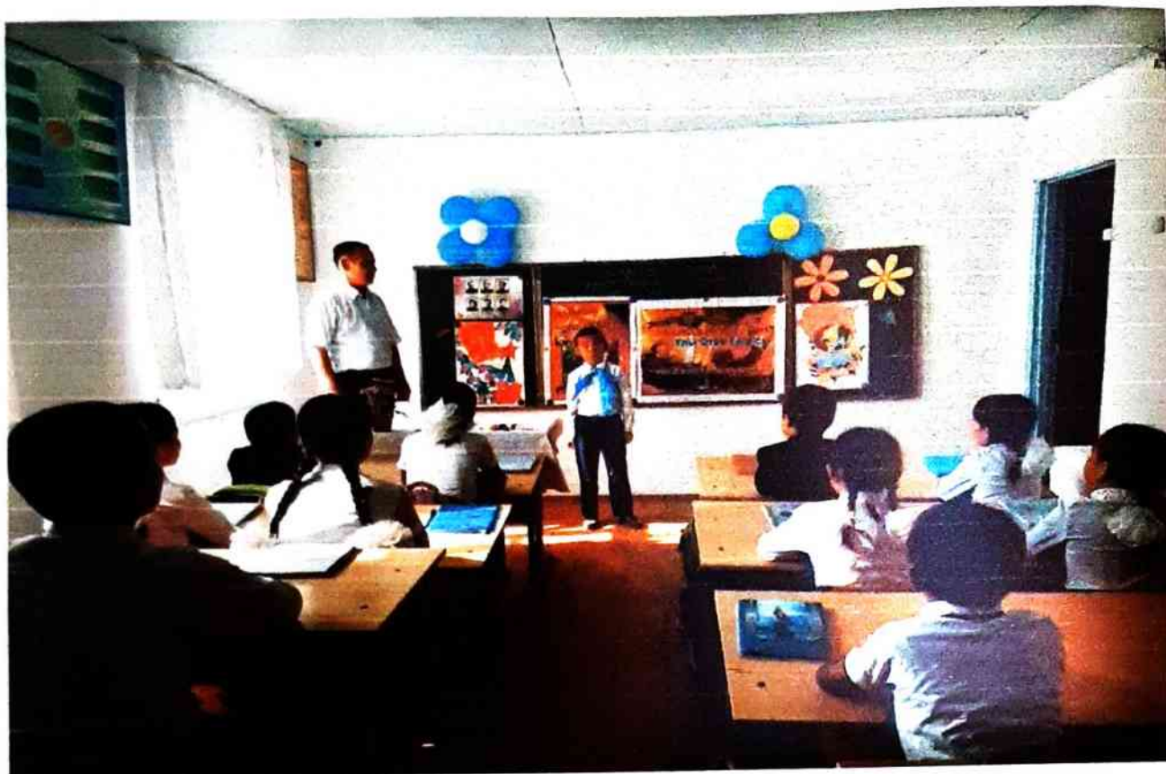
25-мамыр Соңғы коңырау!